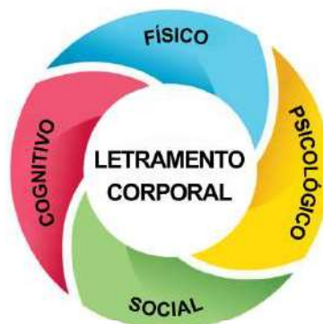
Roda do Letramento Corporal

O conceito holístico do Letramento Corporal pressupõe quatro atributos essenciais que estão fortemente interligados e co-dependentes: motivação e confiança (domínio psicológico), competência motora (domínio físico), conhecimento e compreensão (domínio cognitivo) e envolvimento em atividades físicas para toda a vida (domínio social), como podemos observar na figura abaixo (Carl et al. , 2023; Gleddie; Morgan, 2021).