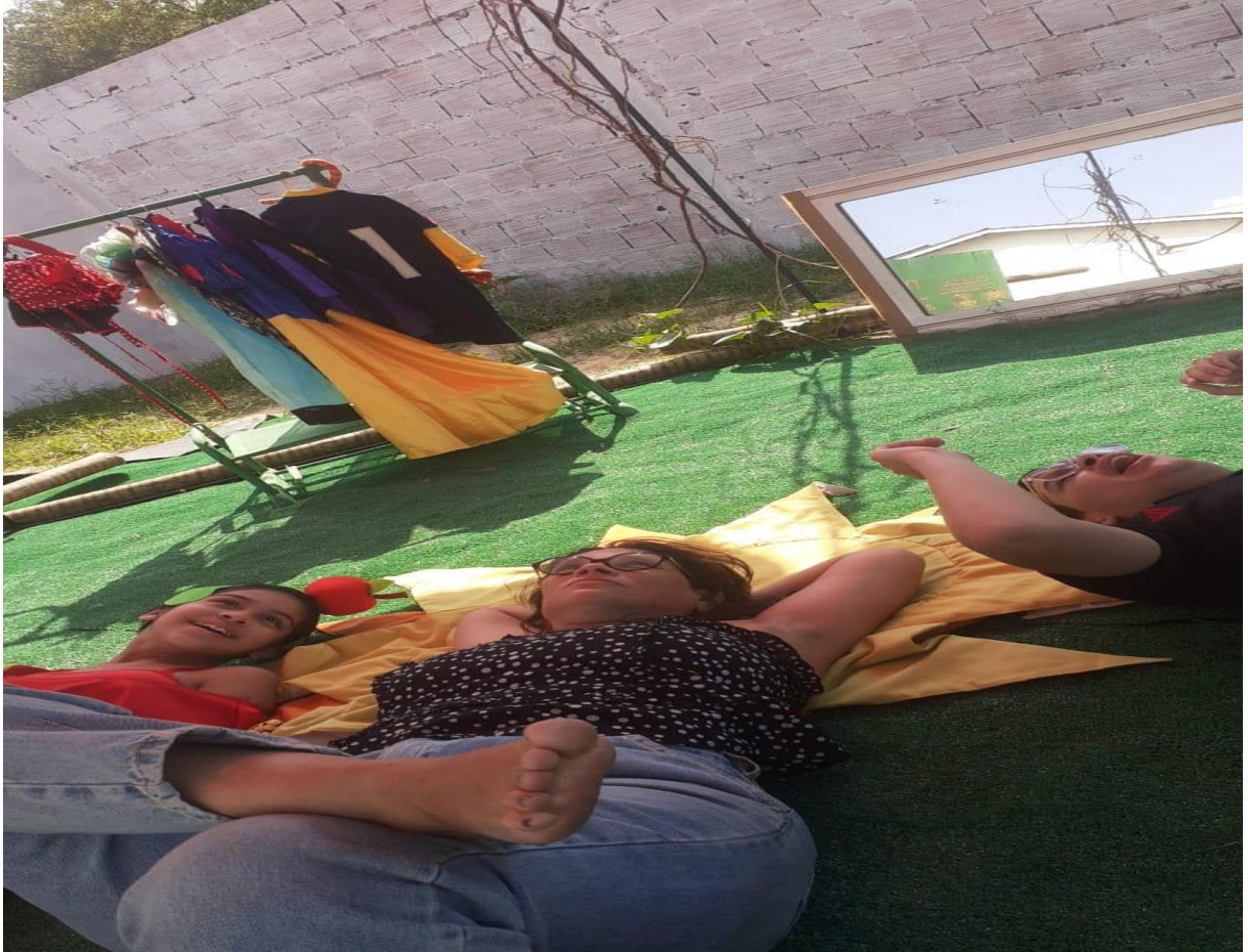
Figura 30 – Visita dos(as) estudantes AEE ao Meu Quintal (setembro de 2024)

como potentes criadores (de bons e maus bocados); porém, feito mágica dos antigos, como já dito, transfiguram fatos em renações-criações, com as influências existentes (interna ou externamente; positivas ou negativas, dependendo dos múltiplos pontos de vista), em vigor para seguir, procriar coisas belas.