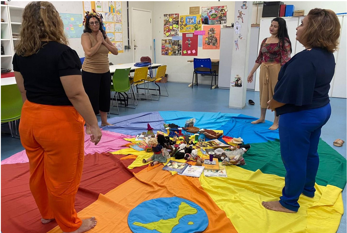
Figura 16 – CRB/CRA no Círculo Cromático da Tenda Brincante com professoras convidadas

Nesse campo, as referências são pertinentes ao tratar as histórias de vida em processos reflexivos, próximos, apesar de outras distâncias, abertos aos sujeitos comuns/singulares e, ao mesmo tempo, derivados/plurais, a elaborarem o existir como são. Considerando que alguns processos reflexivos acerca dos processos (auto)formativos podem ser entranhados na (auto)biografia, é, portanto, necessário contar-se (Olinda, 2018), pois só se existe, se se conta, conhece, escreve. E lembro dos Irmãos Grimm, que intuíram e realizaram muito bem o caminho de inspirações freirianas em forma de círculos reflexivos (Olinda, 2018), feito um ninho construído de afetos curiosos, de registros de histórias valorosas.