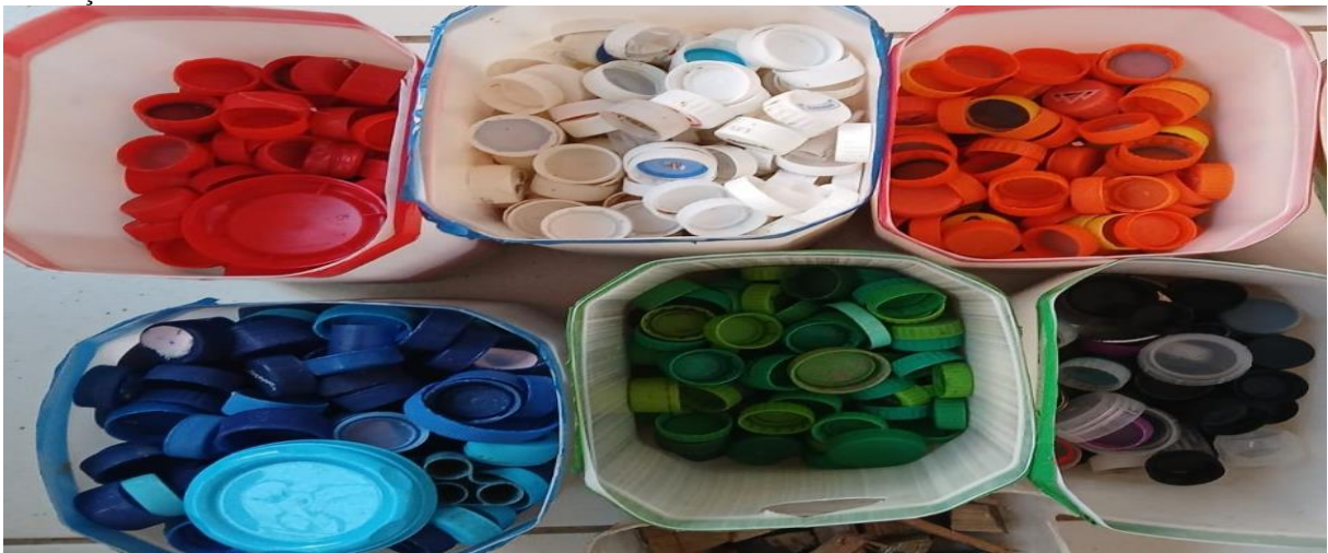
Figura 13 – Materiais não estruturados: sucatas ? Nos restos de tudo, crio e ofereço criação como adulto que guarda a criança curiosa

E também nas múltiplas formas de saber, ser, viver, articular tudo (os restos recompostos) com milhares de novidades do dia, local, produtos do meio industrializados e suas matérias-primas, suas formas de estar e ser cultural e socialmente, sempre provocadoras de conhecimento, antevendo escolhas sem fim.