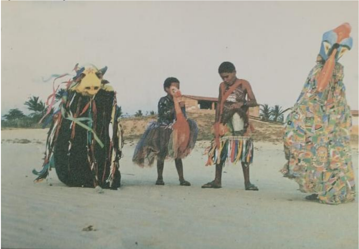
Figura 21 – Cartão-postal (1999)