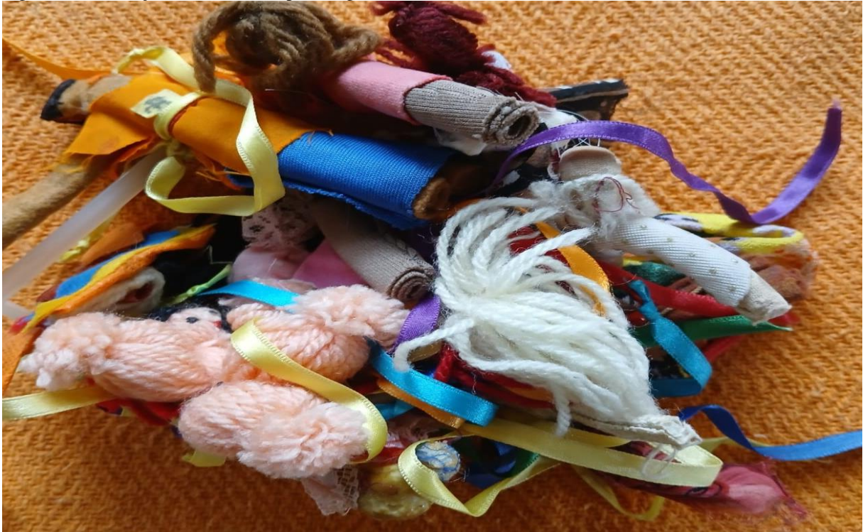
Figura 11 – Adereço de bonecos(as): personagens de histórias vividas

ousadia singular em realizar criações como criança e para criança, por vezes, de corpo inteiro.