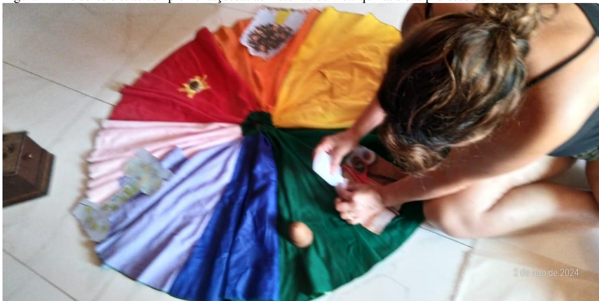
Figura 1 – As cores e suas complementações... as histórias de vida-quintais das professoras