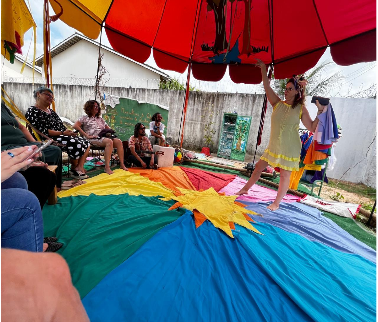
Figura 31 – Defesa da dissertação, um quintal e artes reunidas-religadas

apresentar meu produto artístico quintalzante , nele mesmo.... e por parte da minha querida orientação, banca e coordenação do programa de mestrado, ser quem eu realmente sou, arriscante de outras formas de dissertar.