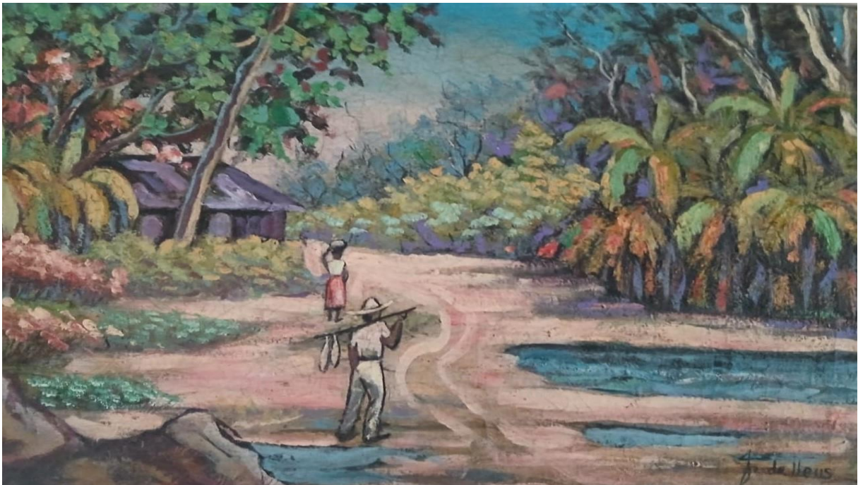
Figura 23 – Negro João de Deus. Rio Janeiro, Teatro Municipal. Cenários, amigo do meu pai. Pintura óleo sobre tela (1966).

Fonte: João de Deus, acrílico sobre tela (1966).