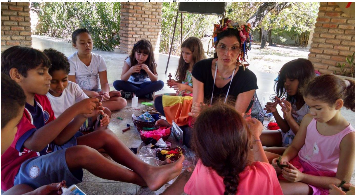
Figura 28 – Oficina de criação e construção de personagens, bonecos de rolinhos de retalho

Pergunto-me, pois me perguntaram, em tom de dúvida e desafio, na ocasião da apresentação de uma das versões do projeto de pesquisa aos colegas mestrands e ao mestre, preparando-nos aos desafios futuros: a escrita de mim/das trajetórias criadoras/dos quintais permanentes em minha forma de ser professora/artista/gente pode dizer ao coração/ação, trazer esperança, concretizar sonhos aos demais professores(as), aos responsáveis por trabalhos com crianças, com adolescentes e famílias? Serão os espaços de fazeres pedagógicos um lugar onde se pode emocionar/refletir afetos e expressões em formas/linguagens variadas e parcerias/interdisciplinares?