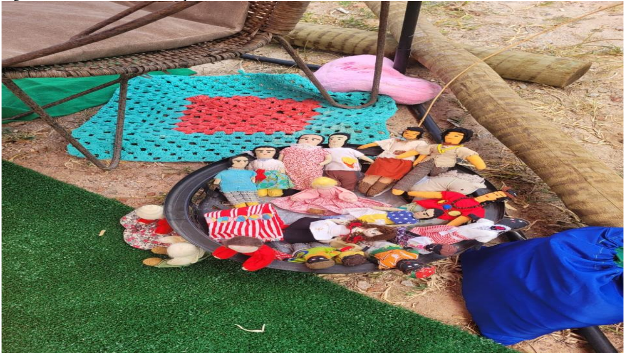
Figura 19 – Nas brincadeiras de quintal, muito se realiza internamente e eternamente.