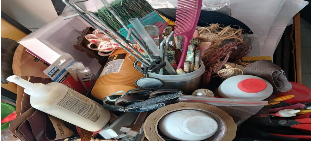
Figura 14 – Por entre materiais, cortantes, pintantes e colantes

para os seus poemas. Um título que harmonizasse os seus conflitos. Até que apareceu Flores do mal . A beleza e a dor. Essa antítese o acalmou. As antíteses conçoam”. E me percebo mais e mais.