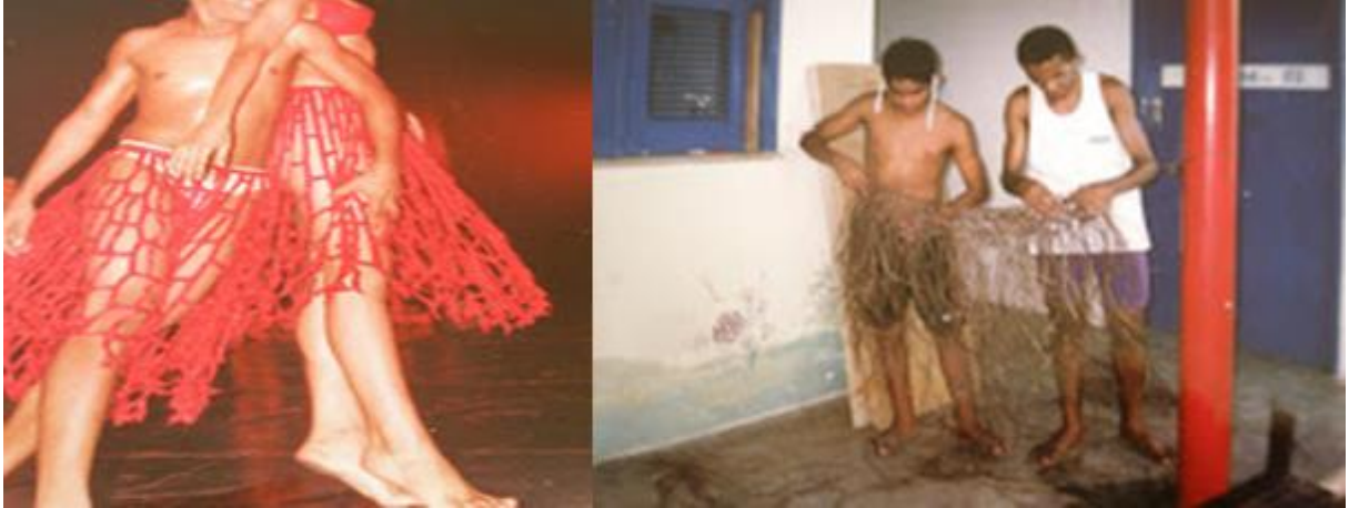
Figura 22 – Saias de fita e cipós. Companhia de dança Vidança . Figurinos espetáculos: Manguê Memórias da Pele