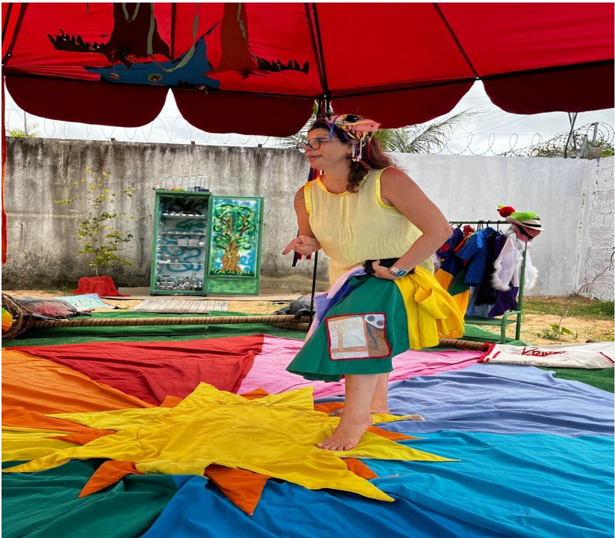
Figura 24 – Árvores-Artefatos aplicadas à saía-brincante, compondo o gomo verde do Círculo Cromático na Tenda Brincante

Como produto de vários quintais, a Tenda Brincante/Círculo Cromático traz trechos das narrativas criadoras construídas-refletidas ao longo de uma vida, conduzidas pelas artesanias intelectuais-sentimentais, uma reunião de bonecos de pano, de fantasias, de insetos gigantes à geladeira-laboratório de cores, de materiais não estruturados e naturais como potentes criadores de criações. É um espaço para fruição, condução de descobertas e alegrias.