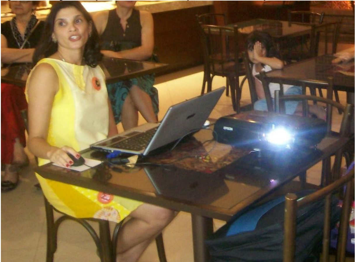
Figura 20 – Na magia das criações: vestido amarelo da coleção Mosaico de Nós , lançamento no Café Lima Verde