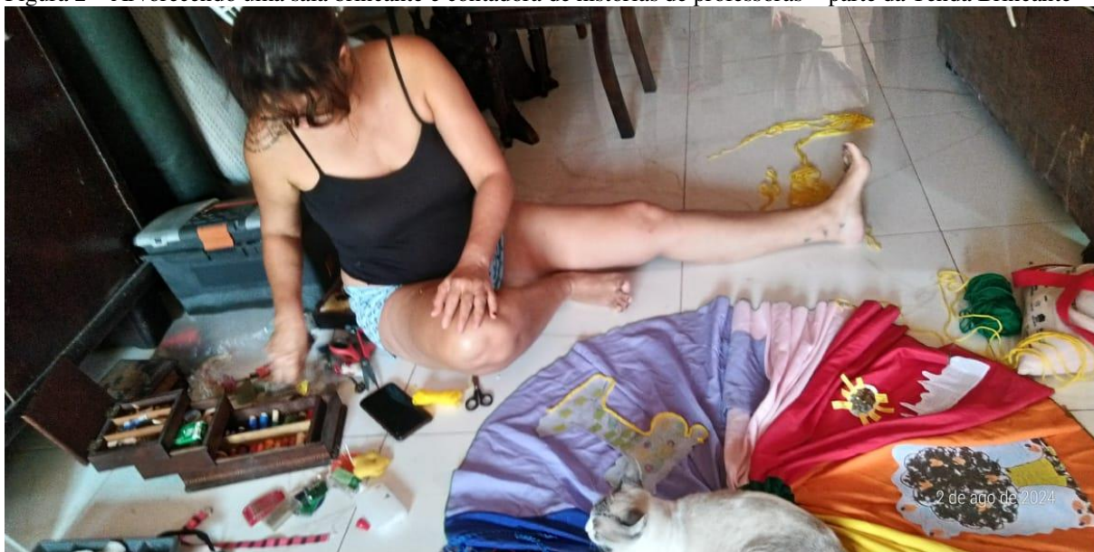
Figura 2 – Arvorecendo uma saia brincante e contadora de histórias de professoras – parte da Tenda Brincante

Dedico este trabalho tão visceral às percepções que só se permitem aqueles que vivem as experiências do ser e estar com/como crianças de corpo inteiro, sem a pretensão de educar ou agir conscientemente, com propósitos firmados, mas realizando cotidianos e seus infinitos processos vívidos. Dedico a todos e todas que me possibilitaram trazer tudo isso em mim. Dedico aos multiespaços/quintais que ecoam em tudo que realizo como professora-aprendente até os dias atuais e, com certeza, os vindouros.