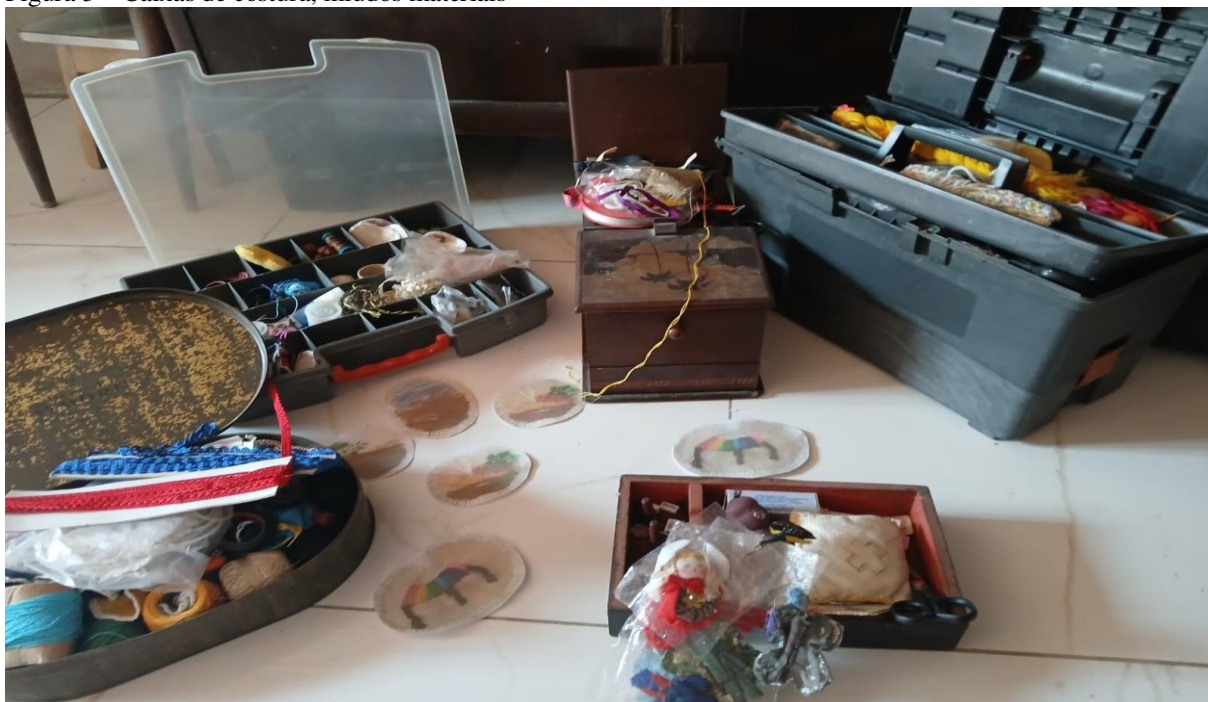
Figura 3 – Caixas de costura, miúdos materiais