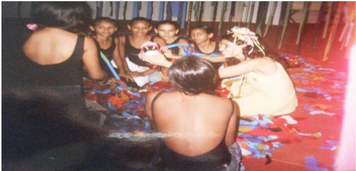
Figura 23 – Dentro da Tenda Brincante: o grupo Edisca participa de uma contação de histórias (VII Bienal Internacional do Livro do Livro, 2007)

A Tenda-Círculo foi criada em 2007 a convite da VII Bienal Internacional do Livro , cujo tema era Mil e uma Histórias . Nesse evento, recebia diariamente mais de 400 crianças de escolas públicas e particulares, equipes de professoras (es), mães, pais, cuidadores em seu ritual mágico de contação de histórias.