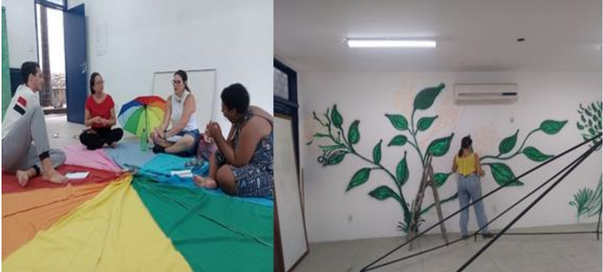
Figura 29 – Encontros e preparação da sala-quintal na Casa José de Alencar.

reencontros de histórias de vida e resistências às famílias atendidas na sala multifuncional da Escola Municipal Jose Carvalho, e visitantes, aos sábados, quinzenalmente, por cerca de dois anos.