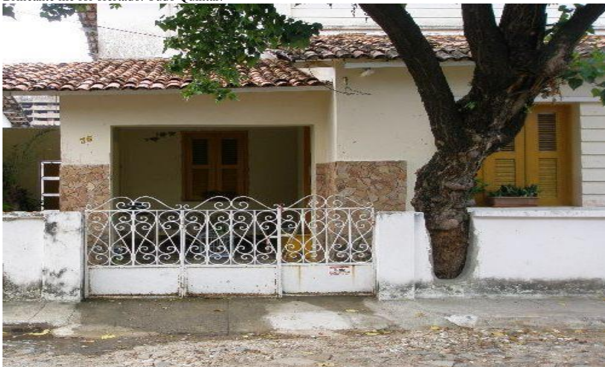
Figura 9 – Casa 36, onde o Ariel cresceu, onde o Atelier Empório do Reino nasceu, onde o sonho da Tenda Brincante me foi ofertado. Tudo Quintal!

Quão criadores são ainda em nós os quintais reverberantes de significados? Quão necessários às professoras que, assim como eu, percebem-se criadoras nas elaborações de quintais? Quantas seremos nós? Quantas nos moldamos a não ser? Quantas rejeitam esse lugar em dores e por quê? Essas questões podem não trazer questionários difundidos pelas redes sociais, nem tabelas explicativas e/ou gráficos contundentes, pois não temos essa intenção; porém, permitem-nos reflexões/ações, daquelas em que se viabilizam os portais de tempo-espaço, da visualização de obras em fazeres pedagógicos e/ou cotidianos que se concebem entranhadamente, sem precisar de fins e começos rigidamente fixados, o que iremos conversar mais adiante nesta dissertação.