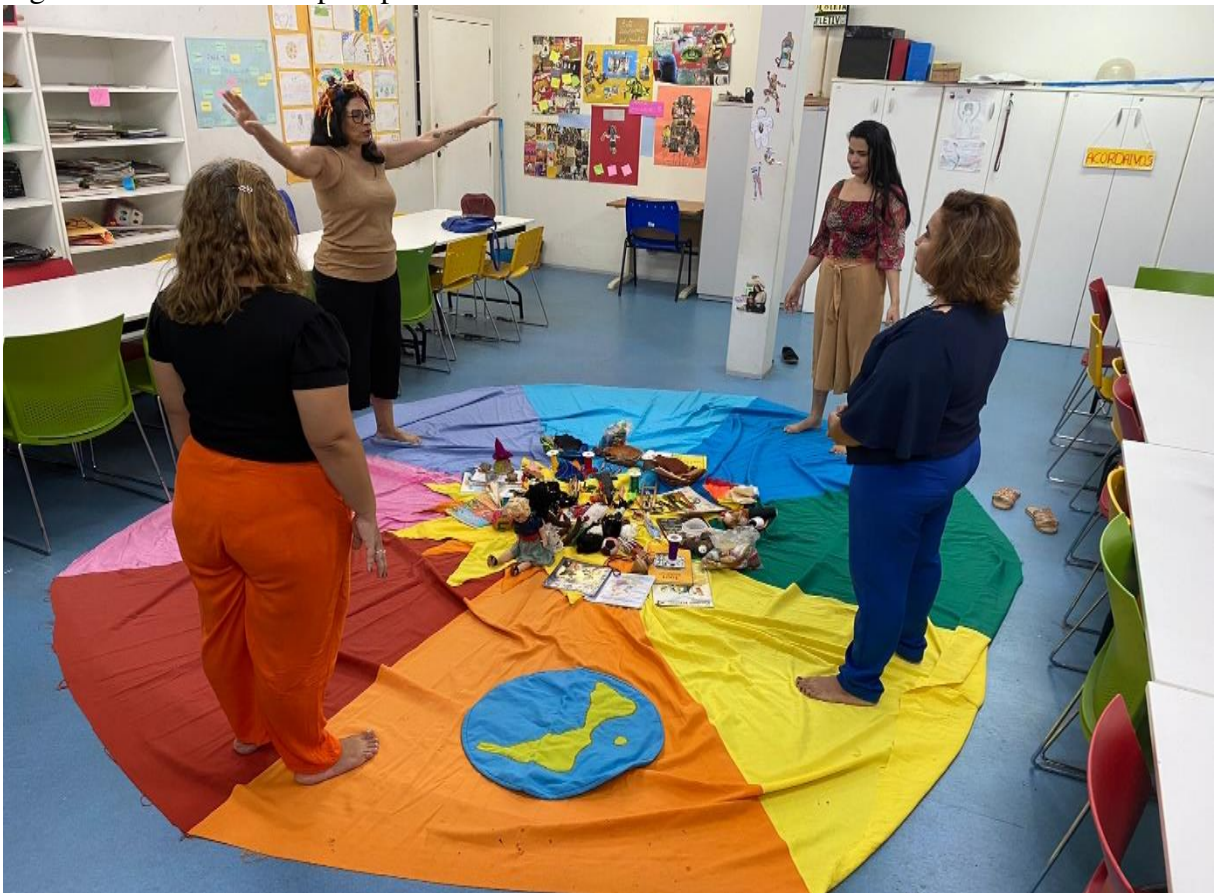
Figura 25 – Um convite para partilhar

E foi assim que cheguei nos nomes das queridas professoras, companheiras de trajetórias. Na figura das Donas Árvores que participaram de suas infâncias, todas elas fazem parte da minha vida, mesmo antes de participarem desta pesquisa: Dona Árvore e/ou Pé de Mangueira; Dona Árvore e/ou Pé de Cajá Umbu; Dona Árvore e/ou Pé de Lençol e Dona Árvore e/ou Pé de Coité/Palmas.