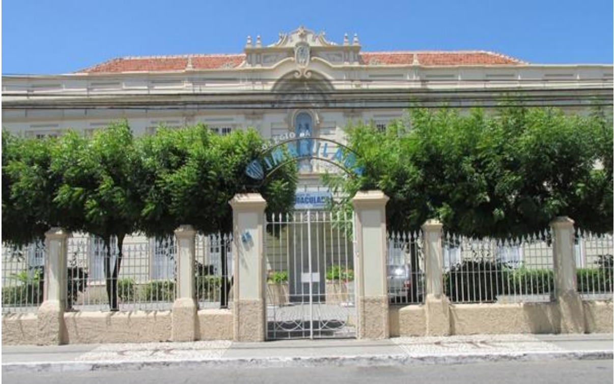
Figura 18 – Colégio Imaculada Conceição: compõe o conjunto arquitetônico da Praça Figueira de Melo, no Centro de Fortaleza